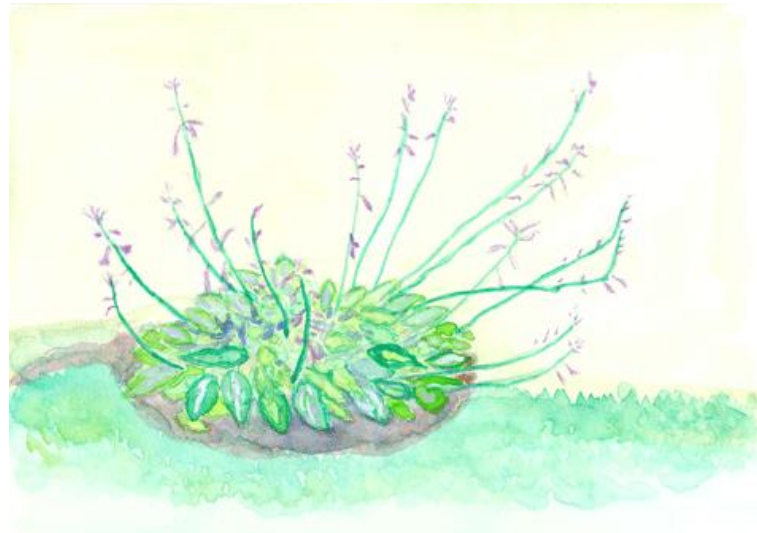
ギボウシ 奥津 紀一